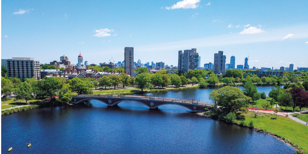
Cambridge y el río Charles.

viviendas . . . Hemos trabajado mucho en opciones de posesión de vivienda para la ciudad, y procuramos tener un programa sólido en el que los residentes puedan inscribirse . . . La conservación también es una parte importante de la política de asequibilidad. Este año, estuvimos trabajando en la asequibilidad de unas 500 unidades en North Cambridge, cerca de los edificios donde yo me crie, e invertimos . . . quizás más de US$ 15 millones, para ayudar a conservar estos edificios a precio de mercado. En esencia, son propiedades que pronto ya no podrán usarse. Es un poco técnico, pero hay muchas herramientas, y aún hay mucho por recorrer.