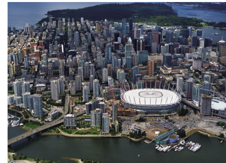
Vancouver, B. C., exige contribuciones a los desarrolladores que financian viviendas asequibles, ciclovías, parques, guarderías infantiles y otros servicios.