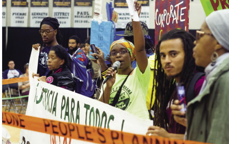
Una coalición de grupos de vecindarios que estuvieron al frente de la crisis de desplazamiento de Boston protestan en la conferencia nacional YIMBYtown, que tuvo lugar en esa ciudad en 2018.