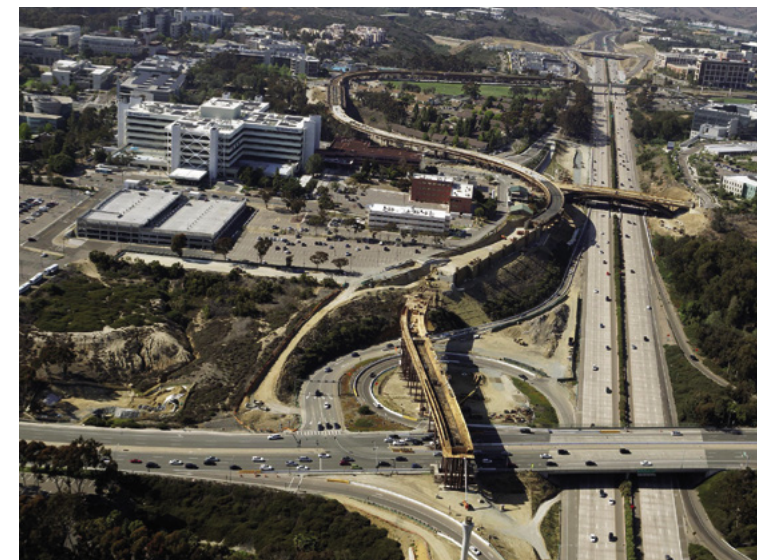
Kevin Faulconer, alcalde de San Diego, adoptó el enfoque de YIMBY y prometió aumentar la densidad en las bandas de tránsito.

Muchas ciudades relacionan la mejora de la zonificación con requisitos de asequibilidad, como viviendas inclusivas: los nuevos desarrollos residenciales deben incluir un porcentaje de viviendas asequibles o proveer fondos para que se pueda construir la misma cantidad de viviendas asequibles en otra parte de la comunidad.