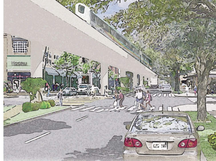
Debido a que la línea de ferrocarril de Honolulu aumentó el valor de las propiedades cercanas, los requisitos de asequibilidad ayudarán a garantizar que la comunidad obtenga beneficios.

consumidores siguen pagando precios más altos, a pesar de que la oferta aumenta— y que los alquileres podrían estar más determinados por los servicios en los vecindarios deseados o en transición (Anenberg 2018). La conclusión es que, incluso si una ciudad pudiera relajar algunas restricciones de oferta para alcanzar un aumento marginal en la disponibilidad de viviendas, no vería una reducción significativa en las cargas de alquileres.