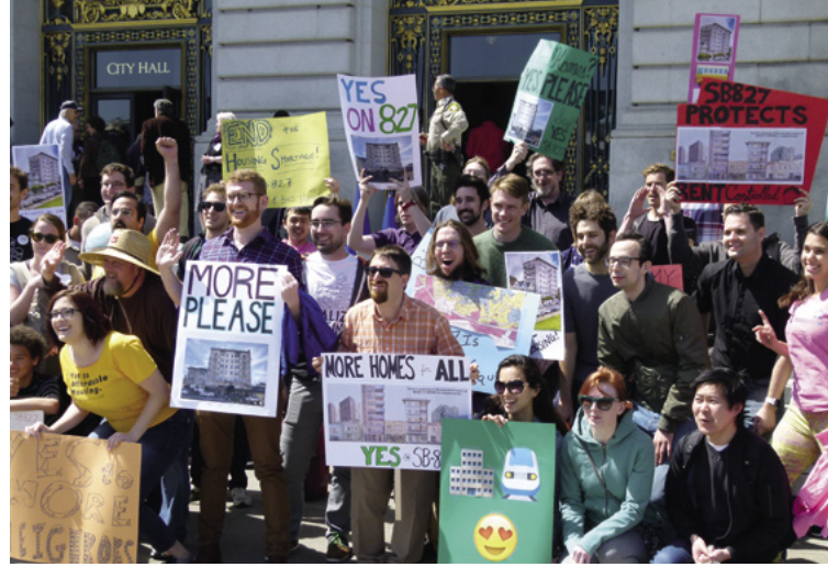
Los defensores de YIMBY se convocaron para protestar en San Francisco en apoyo del proyecto de ley del Senado (SB) 827, en 2018. El proyecto de ley habría acelerado la producción de viviendas multifamiliares cerca de estaciones de tránsito.

La captura de valor territorial es un enfoque de políticas que les permite a las comunidades recuperar y reinvertir los incrementos en el valor de la tierra que surgen de la inversión pública y de otras medidas del gobierno. Tiene sus orígenes en la noción de que las acciones públicas deben generar un beneficio público.