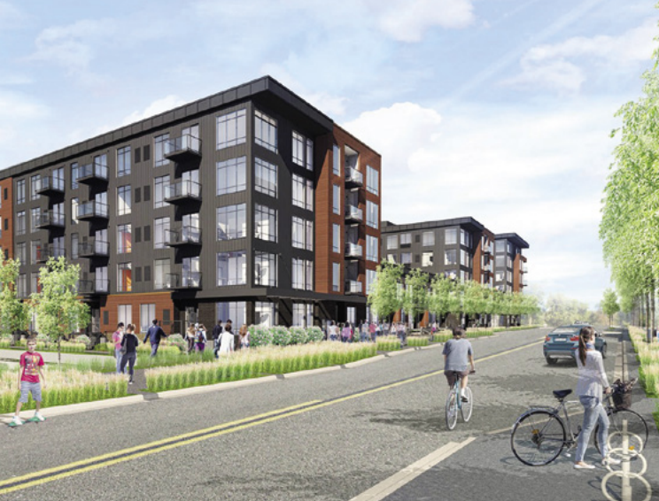
En Green on Fourth, un nuevo complejo de departamentos en Minneapolis, más del 25 por ciento de las unidades se asignarán como viviendas asequibles.