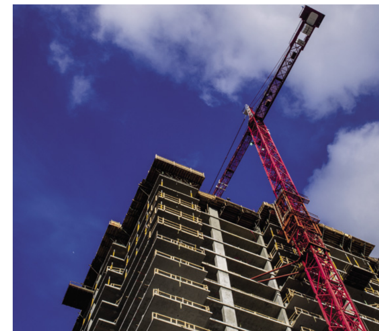
Las nuevas construcciones residenciales en ciudades como Seattle incluyen cada vez más requisitos para que los desarrolladores reserven una parte del proyecto para viviendas asequibles. Crédito: Ajay Suresh/Flickr CC BY-NC 2.0

“Debemos concentrarnos en la situación general: las ciudades como Seattle necesitan agregar cuantas viviendas [puedan] lo más rápido posible. Parece que la gente se queda con cuán justo es eso . . . que los propietarios y los desarrolladores nadan en oro”, dice. La ola de empleos tecnológicos en ciudades como esta se debería considerar un “regalo”, dice, que terminará por ayudar a toda la ciudad.