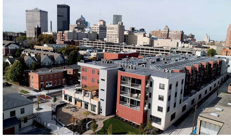
Una nueva construcción en el sitio del antiguo Inner Loop de Rochester incluye Charlotte Square on the Loop, un complejo de departamentos con viviendas asequibles.

Al quitar el tramo de la autopista, “mejoró toda la zona céntrica”, dice Frisch. “La vimos resurgir con fuerza, porque creamos lugares de valor donde la gente quiere invertir”. Además, la ciudad les ahorró a los contribuyentes US$ 34 millones porque evitó los futuros costos de reparación y mantenimiento en el ciclo de vida de la autopista exigidos a nivel federal. “Eso de